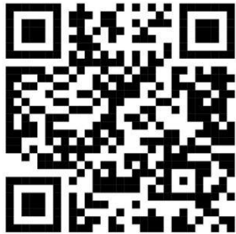
เริ่ม 25" ตรังเกมส์