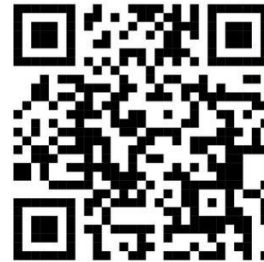
เพลงสปิริตและมิตรภาพ