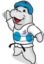
เทควันโด (Taekwondo)