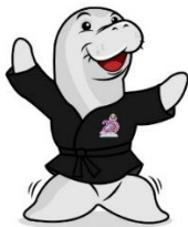
เป็งกักลีต (Pencak Silat)