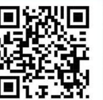
เพลงตรังเกมส์