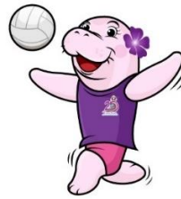
วอลเลย์บอล (Volleyball)