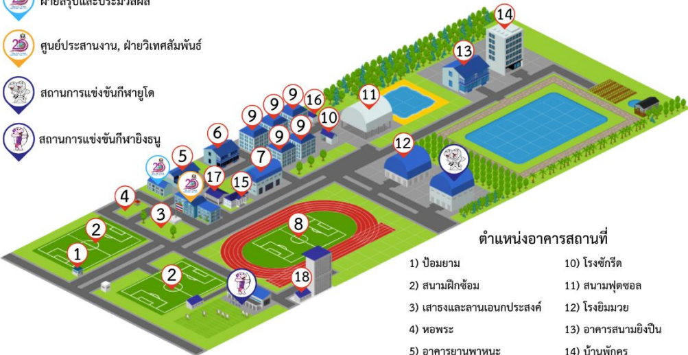
ตำแหน่งอาคารสถานที่