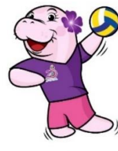
แฮนด์บอล (Handball)