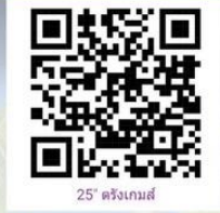
25 ตรังเกมส์