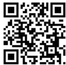
เพลงสปิริตและมิตรภาพ

* (ซ้ำ 2 รอบ) ผูกมิตร คล้องไทย ด้วยไมตรี