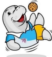
เซปักตะกร้อ (Sepak Takraw)