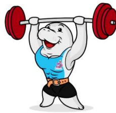
ยกน้ำหนัก (Weightlifting)