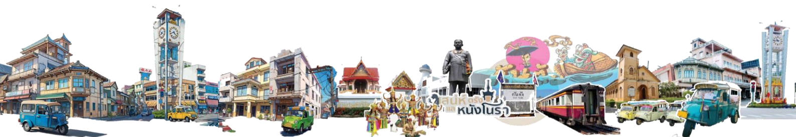
เพลง สปิริตและมิตรภาพ