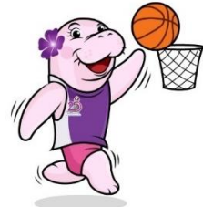
บาสเกตบอล (Basketball)