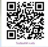
โรงเรียนกีฬา จ.ตรัง