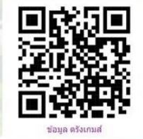
ข้อมูล ตรังเกมส์