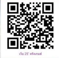
เว็บไซต์ ตรังเกมส์